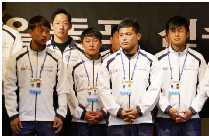
全国各地から集まった各競技の選手たち