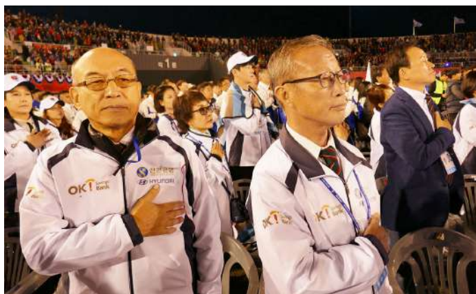
3 万人の観衆が見つめる中、国民儀礼を行う在日同胞選手団