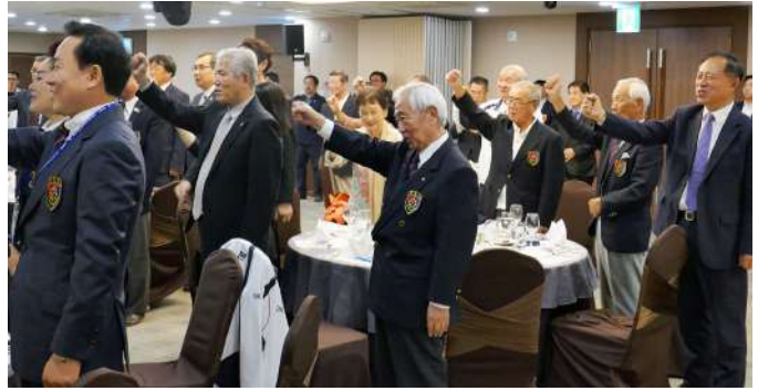
選手団長の発声に続く顧問団の方々