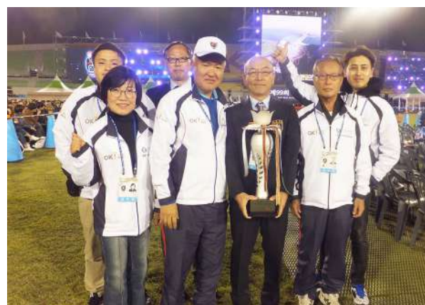
総合優勝 7 連覇を勝ち取った在日同胞選手団