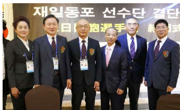
千憲司選手団長をはじめとする副団長の方々