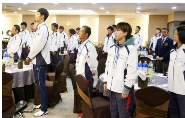
総合優勝を誓う在日同胞選手団