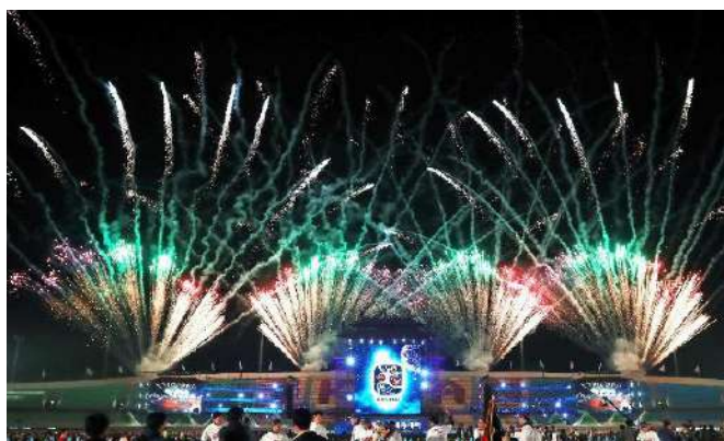
大会の終わりを告げる花火が打ちあがる