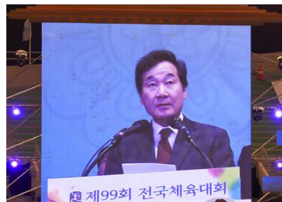
スピーチする李洛淵國務総理