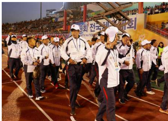
3 万人の観客を目の当たりにし胸が高鳴る選手たち