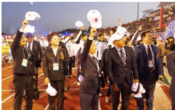
観客席に手を振る在日同胞選手団