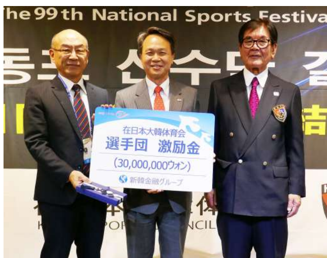
新韓金融グループの晋玉童副社長から選手団に激励金を伝達