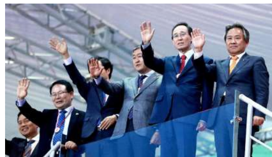
選手団に歓声を送る 宋河珍全羅北道知事や李起興大韓体育会会長