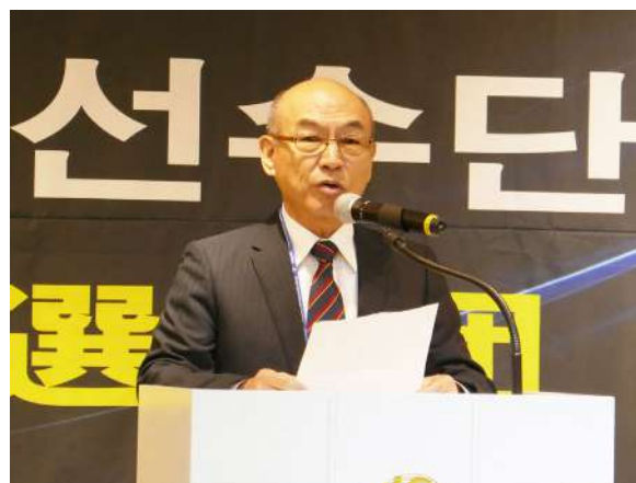
みんなで7連覇を勝ち取ろうと挨拶した千憲司選手団長