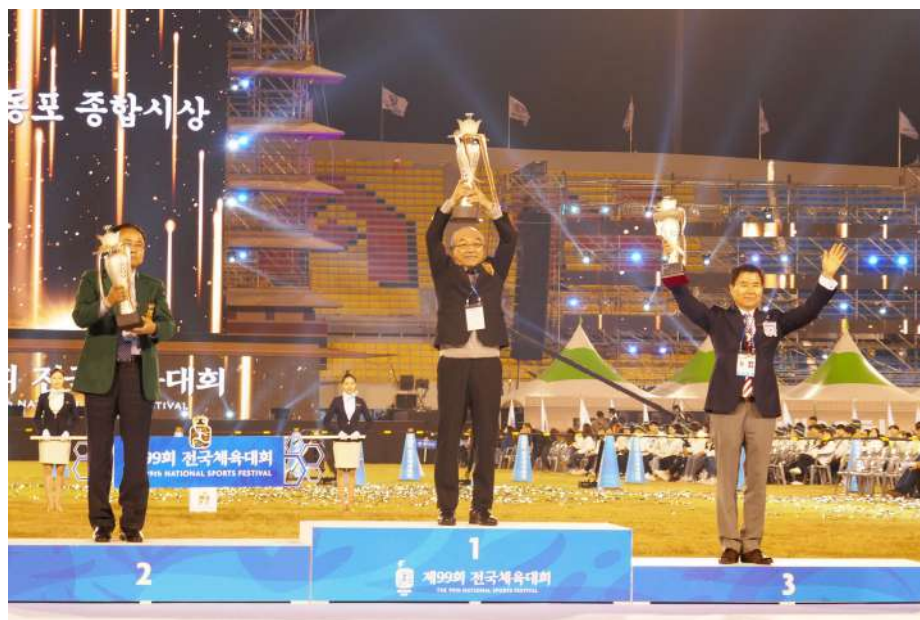
表彰式でトロフィーを授与された各国の選手団長 （写真左から豪州、在日本、在米）